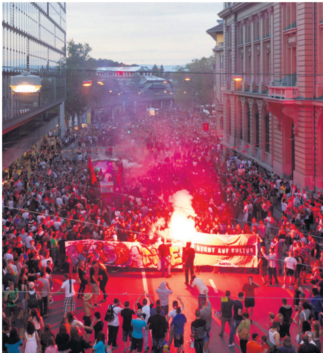
Dix mille jeunes sont descendus dans la rue ce week-end à Berne.

Quelques heures après la démission de la ministre de l'Éducation Line Beauchamp, 70 musiciens issus de l'Université et du Conservatoire de Montréal ont interprété l' Ouverture 1812 de Tchaïkovski. «Désolé du dérangement, on essaie de changer le monde», a