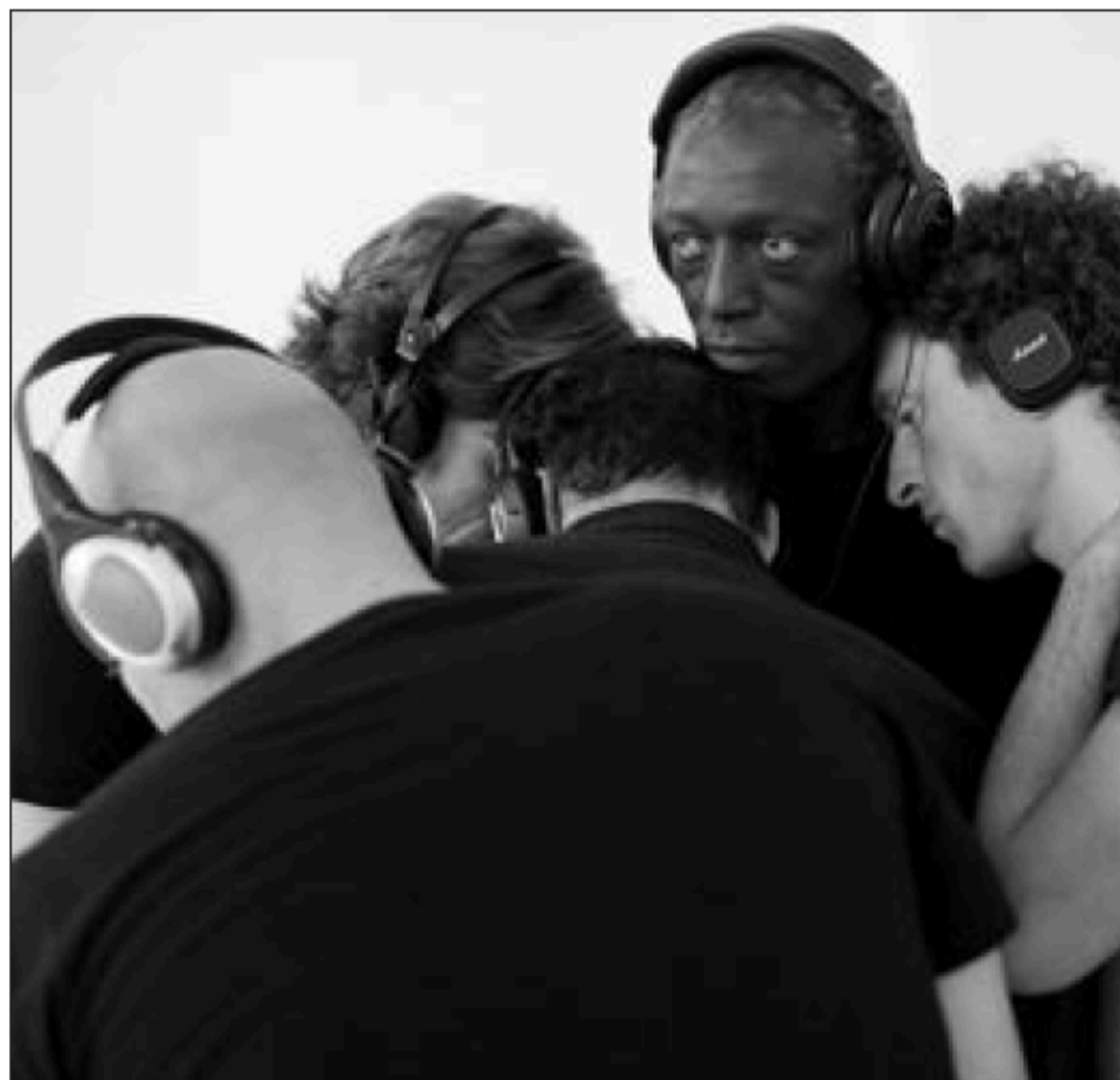
Howl, une performance pour trois acteurs et un guitariste d'après le poème éponyme d'Allen Ginsberg.

• Samedi à 15h et 17h, et dimanche à 15h , Howl , une performance de Maya Bösch pour trois acteurs et un guita-riste autour du poème mythi-que d'Allen Ginsberg. Présen-tée à la Biennale Charleroi-Danses et au GRÜ/Transthéâtre à Genève, cette performance évolue et se développe en fonc-tion des lieux qui l'accueillent.